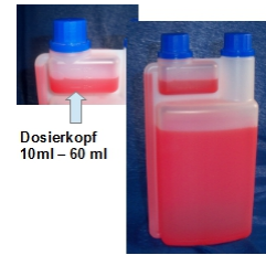
Dosierkopf 10ml - 60 ml

mit Dosierkopf 60ml Füllinhalt 1000ml - Dosierkopf bis 60ml